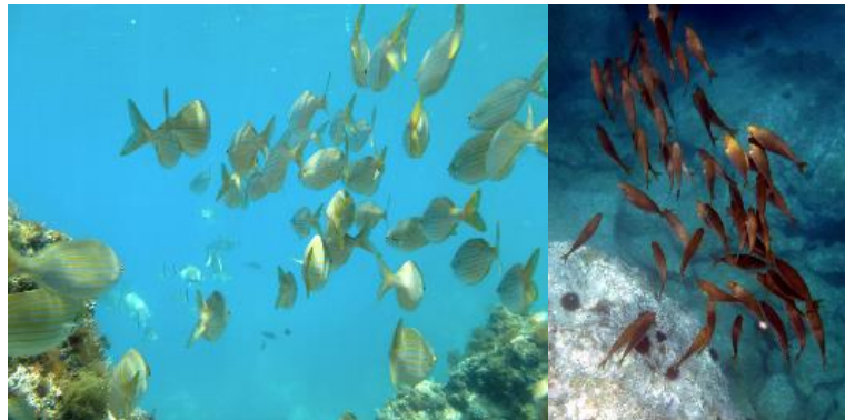
Figure 1. Deux espèces méditerranéennes parmi 288 analysées © Nadia Faure. Juillet 2017

Dans cette étude, les chercheurs ont comparé les effets de la représentativité en espèces et de la connectivité sur la persistance des espèces protégées dans la désignation de nouvelles AMPs.